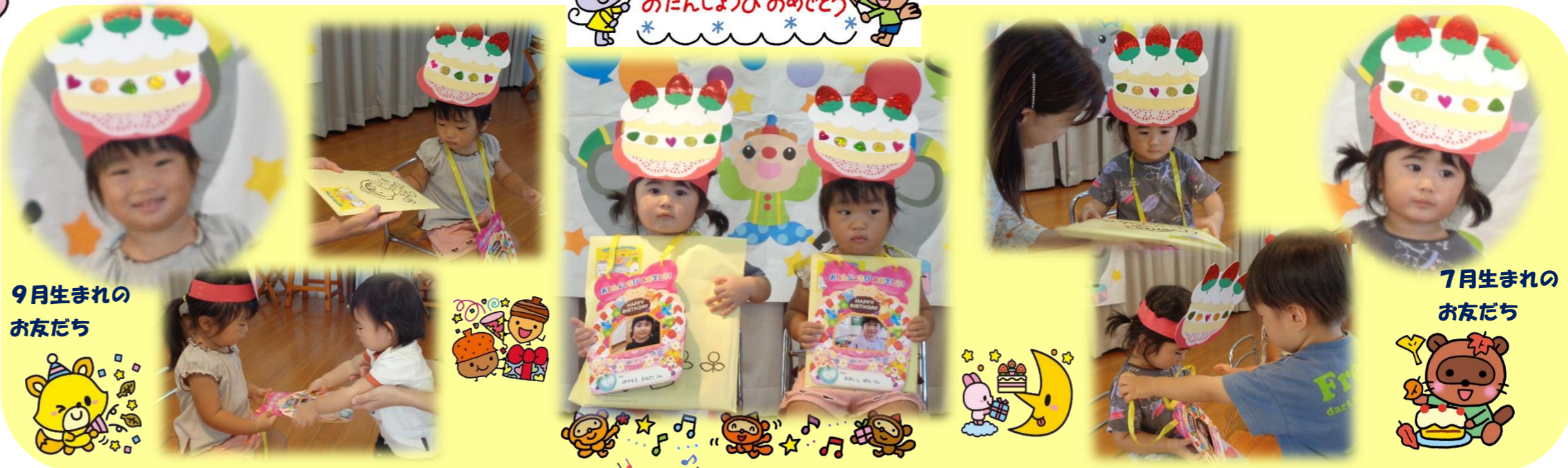
9月生まれのお友だち